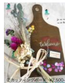
②カッティングボード ¥2,500