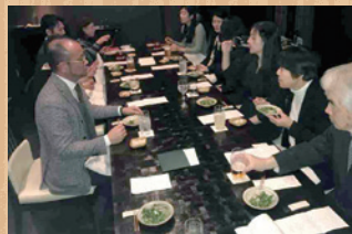
懇親会も 盛り上がりました!

人気の設備を追加 してライバルに勝つ! 導入費用はかかりません。 4月の下旬までは繁忙期 が続きます。 絶対にこの時期に満室に したいと、社員全員で がんばっています。 ご協力お願いいたします。