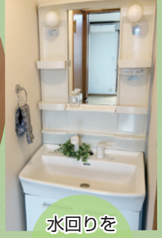
水回りを グリーン で飾る。