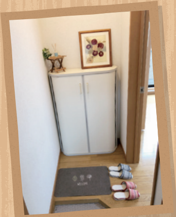
玄関にマット、スリッパ でお迎える。

今回は繁忙期の空室対策として、モデルルームの作り方をお伝えしたいと思います。 モデルルームというと、少しハードルが高いと思われるかもしれませんが、始めから大きな家具を入れる必要はありません。 まず小さな小物を飾り付けるところから始めてみるのが良いと思います。