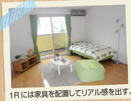
1Rには家具を配置してリアル感を出す。