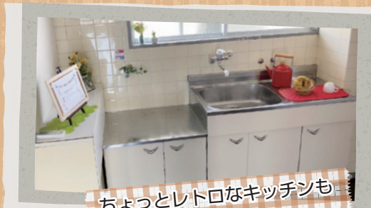
ちょっとレトロなキッチンも 明るさをプラスする。