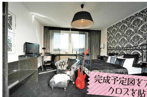
完成予定図をアプリで作りクロスを試してみる