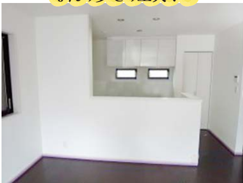
ほんの少しの工夫で...

2017年に流行語大賞にもなった「インスタ映え」。その勢いはますます加速していています。スイーツはもちろん、オシャレな場所や、面白いもの、日記代わりに日々を記録している人も増えています。芸能人のインスタも人気を集めていますね。その流行に乗ってか、そうではないのかはわかりませんが、最近「コンセプト賃貸」や「カスタマイズ賃貸」が少しずつ増えて来ています。簡単に説明をすると「コンセプト賃貸」とはあるテーマに特化したお部屋。例えばカフェ風やバイク好きのために作られたもの。「カスタマイズ賃貸」とは自分好みにカスタマイズ出来るお部屋のこと。カスタマイズ賃貸はご入居者様が自分で室内の改装を行うのでオーナー様の費用負担が少なく済むというのが利点ではありますが、その分家賃設定を周辺相場より低くする必要がありますし、お部屋の出来上がりを確認出来ないという不安も残ります。その点、コンセプト賃貸はオーナー様側でのハンドリングが出来るので安心です。大がかりなリフォームが難しい時に「クロス」と「照明」と「小物」をプラスするなどのちょっとした工夫でお部屋の雰囲気随分変わります。これからは目指せ「インスタ映え」かもしれません。