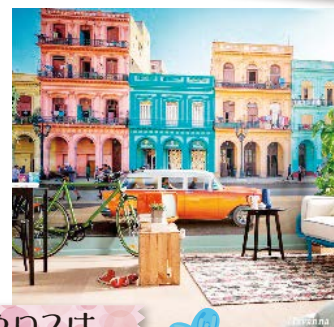
輸入品クロスは遊び心も満載です