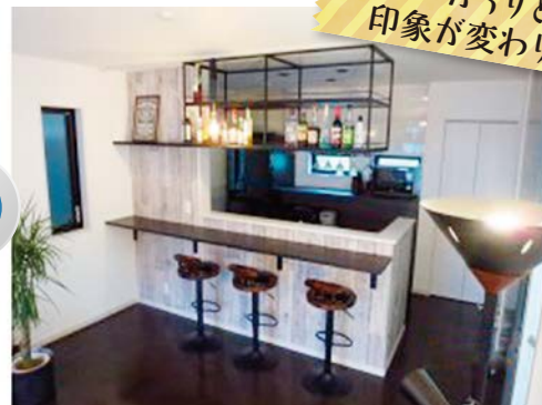
がらりと印象が変わります