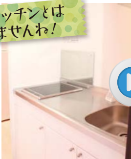
同じキッチンとは思えませんわ!