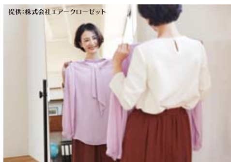
所有しなくても色々な服が楽しめる

トが服を選んでくれるので、コーディネートはバッチリ。 高級バッグシェアの「Laxus(ラクサス)」では、エルメスやルイ・ヴィトンなどの貸し出しをしています。借りるだけでなく、ブランドバッグを持っている人が貸し出すことで副収入を得られる仕組みもあり、持っている人、持っていない人の相互のシェアサービスが特徴です。 女性にとって、服もバッグも「新作を取り入れたい」「参観日には素敵な装いで出かけた」「シーズンごとに変えたい」という願望があります。その都度出費が高むことが頭の痛い問題となっていました。これらのサービスは女性の願望を叶えることができるのです。ここで紹介したシェアサービスは、ほんの一部です。このようにモノを所有しなくなったことで、住宅の間取りや収納スペースのあり方も少しずつ変化していくのかもしれない。