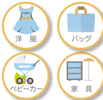
シェアできるモノ

新し物好きな女性に特化したシェアサービスも続々と登場しています。洋服のシェアサービスを提供しているのは、「air Closet(エアークローゼット)」。同社によると、毎月数千円の負担で洋服が借り放題になり、会員は着た後は洗濯もクリーニングせずに専用の袋に入れて郵送で返却できます。スタイリス