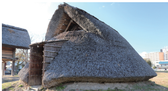
静岡県静岡市にあった登呂遺跡の竪穴住居 住居内には、火を使って調理した痕跡も

日本の家の始まりは、縄文時代まで遡ります。それまで洞窟などで生活していた人たちが集落を作って稲作を始めた際、田畑の近くに定住できるようにと作られたのが「竪穴住居」と言われています。