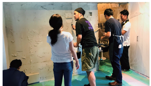
インストラクターが塗装の方法をレクチャー

「暮らしのしあわせ通信」は、編集部が全国の大家さんを取材し見えてきた、住み手も貸し手もワクワクできる賃貸経営のコツを掲載します。近頃の賃貸経営は、一般企業と同じようにコンプライアンスや先行投資といった経営戦略が求められるようになりました。とりわけ顧客満足の向上は、大家さんにとっても至上命題と言えるでしょう。しかし、難しく考えることはありません。賃貸経営には、一人一人の大家さんの個性や持ち味が生かせる場面がたくさんあります。ぜひ、あなただけの賃貸経営プロジェクトを成功させましょう。