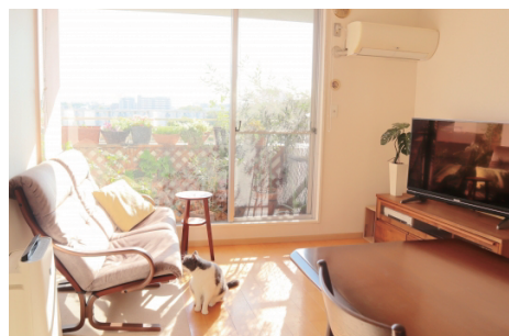
“おうち時間”が増えたことで、 陽当たりや騒音も気になるように