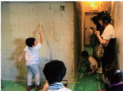
子供も楽しそうにペイントを体験

「DIY」は「DO IT YOURSELF」の略で、直訳すると「自分(自身)でやる」という意味です。専門家の力を借りずに自分で棚を作ったり、壁を塗ったりすることを言います。材料は自分で購入する必要がありますが、その分、低コストで自分好みにアレンジすることが可能です。