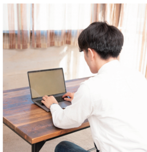
在宅勤務の増加で、 専用スペースのニーズ増

ライフスタイルが変わって、働き方が変わって、家だけ変わらないうちのことはありません。日本の総世帯の35%が住む賃貸住宅こそ、その先頭を切って変革を推し進めてほしいと思います。一國一城の主である大家さんにはその権限と力があります。責任も。昨年の秋口にインタビューをし